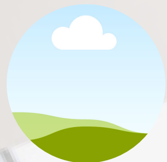
Марија Ћуровић наставник ликовне културе