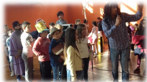
5.10.2018.год. Маскенбал на нивоу града Краљева