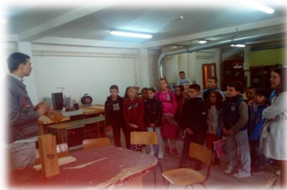
4.10.2018.год. Школски маскенбал